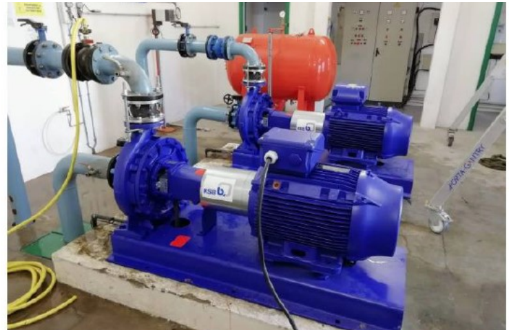
Changement des pompes de la station de reprise Chemin Bas d'Avignon

L'avenant change également l'indice de révision de la part qui revient au concessionnaire, afin que celui-ci soit connu au 1er janvier. C'est une demande que nous exprimions depuis 18 mois, afin que les élus votent la part de l'agglomération en connaissant l'évolution de celle du concessionnaire. Nous nous réjouissons d'avoir été entendus.